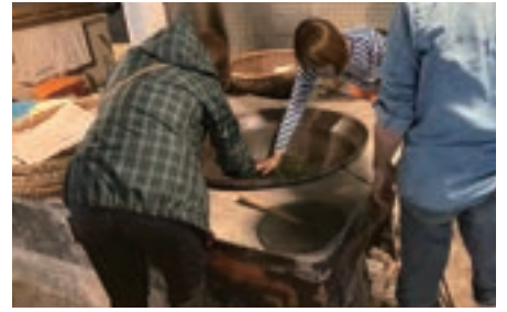
▲大釜での釜炒り作業

やま学校の最後はティータイム。出来上がったばかりの釜炒り茶と地元加工グループの「よもぎだんご」をいただきました。釜炒り茶のすっきりとした香りと甘いお団子がとてもよく合います。出来立てのお茶をいただく機会はあまりないので、貴重な経験になったと喜んでいただけました。