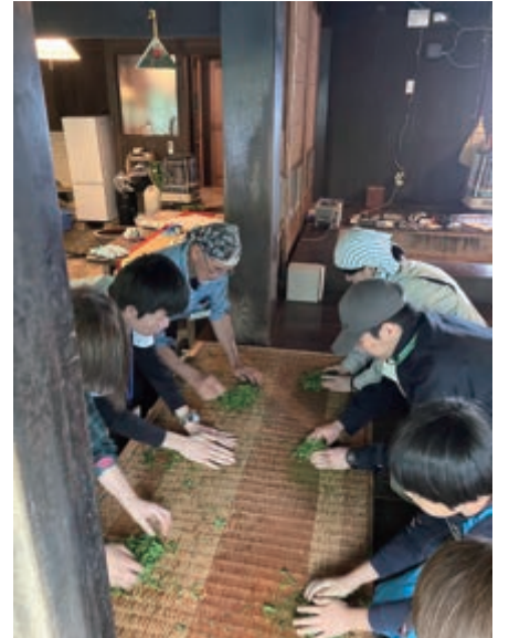
▲茶揉み台は竹製です!!